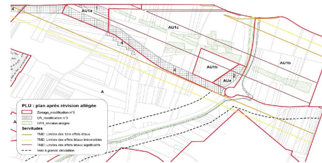
Plan de zonage après modification et révision allégée