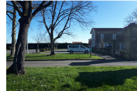
Vues du site