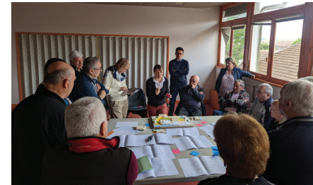
Visite de site et travail en ateliers