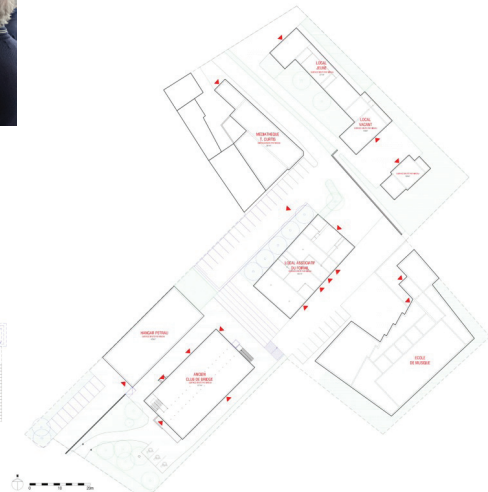
Scénario de requalification des abords, Selva.Maugin