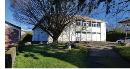
Vues du site

L'équipe a rédigé le programme fonctionnel nécessaire à la consultation.