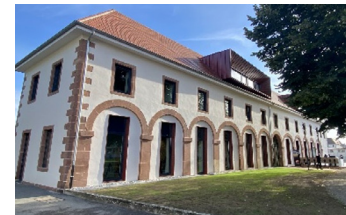
Référence, écuries d'Haguenau