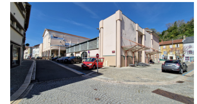
Les halles, existant