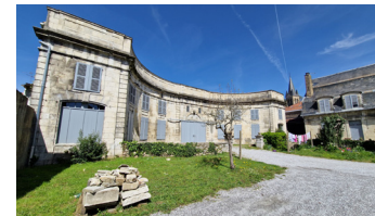
Les écuries, existant