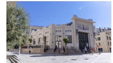
Référence, halles de Toulon

Test de requalification des anciennes écuries et des halles