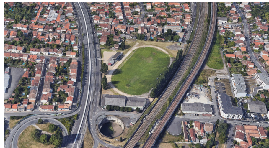
Le site Léo Lagrange et ses abords

Une approche sommaire des coûts de travaux et une série de références illustrées ont permis aux élus de se projeter et de formuler des choix programmatiques et urbains en amont de la phase de programme technique détaillé.