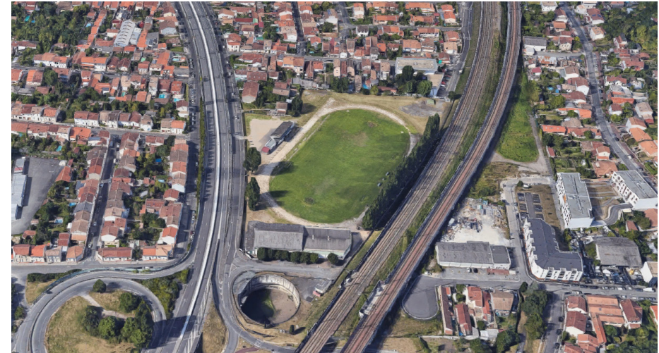
Le site Léo Lagrange et ses abords