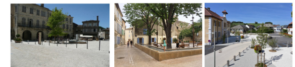
Eauze (32, source Atelier Lavigne) Saint-Rémy de Provence (13) Héry-sur-Alby (74)