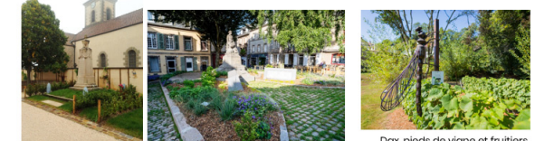
Verdissement des monuments aux morts, Chamboauf (21) à gauche, Lannion (22) à droite Dax, pieds de vigne et fruitiers