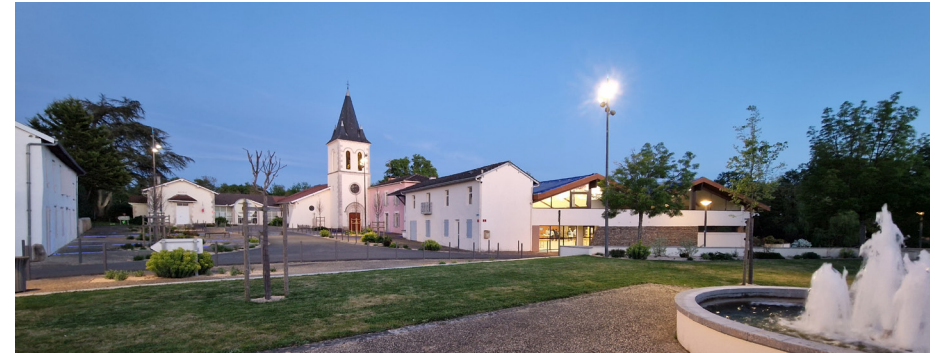
Place de la mairie

mobilités douces, espaces publics, redynamisation, implication, stratégie, logements, commerces, équipements