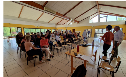
Ateliers de concertation