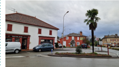
Vieux Bourg et Bourg Neuf