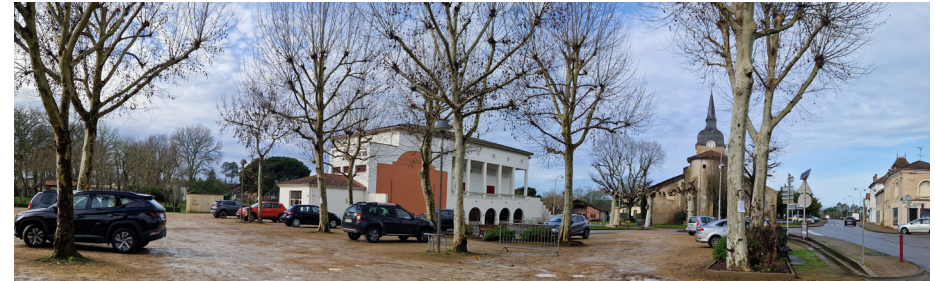
Place du marché, un espace public fédérateur à requalifier

Dans ce contexte, l'équipe d'Urban ID assiste les élus pour définir les grandes actions à engager dans les 15 ans à venir, à les hiérarchiser et les chiffrer pour les planifier dans le temps et mobiliser les partenaires. Des temps de concertation permettent de recueillir l'avis, le ressenti et les attentes des habitants : entretiens, ateliers, présentations publiques ponctuent la mission.