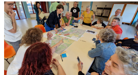
Ateliers de concertation